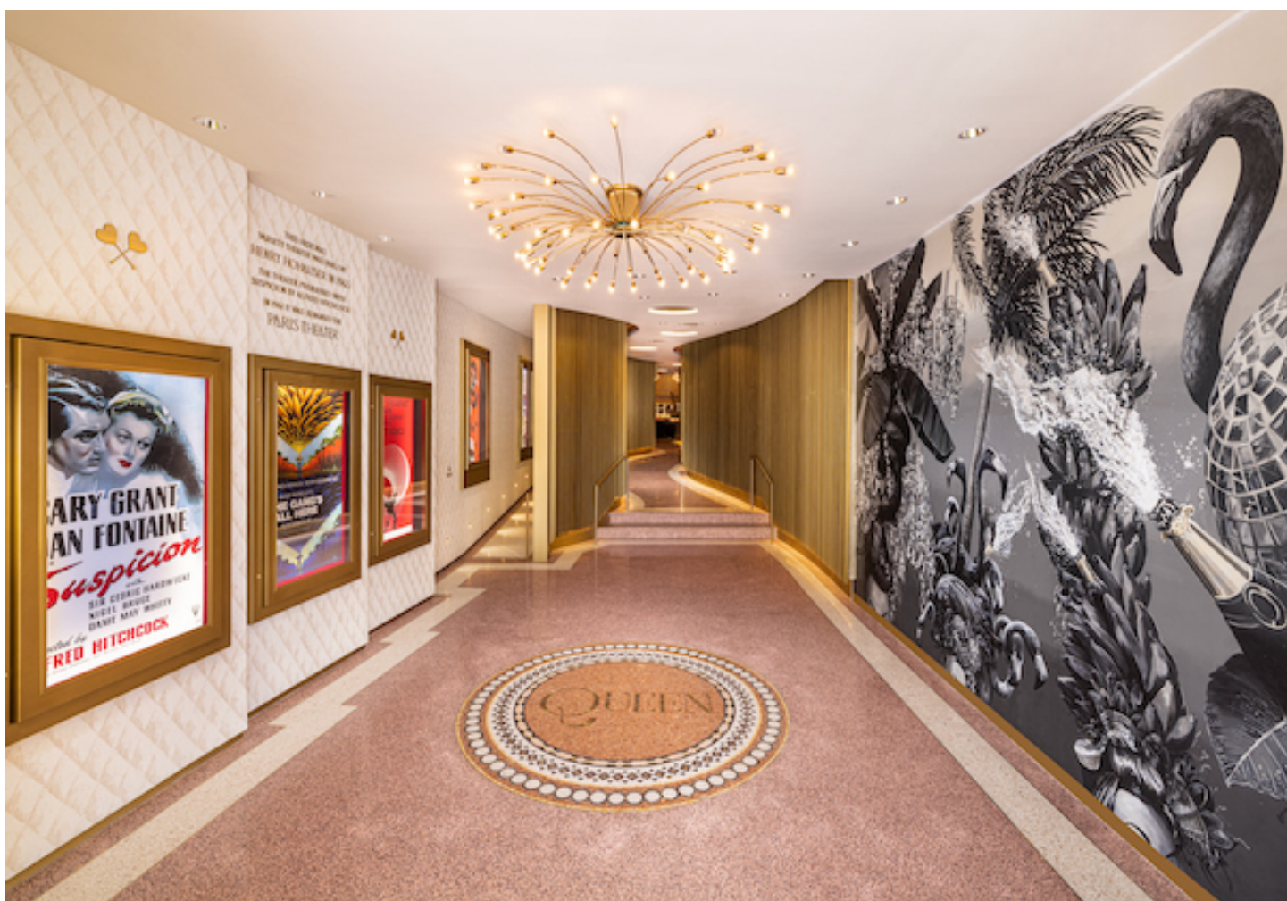
Queen Miami Beach, un proyecto de Carlos Rodríguez de ModPlay Studio.

El proyecto y realización es del renombrado diseñador de interiores latino Carlos Rodríguez de ModPlay Studio , que reformó el espacio con el objetivo de conservar detalles arquitectónicos de los años 40.