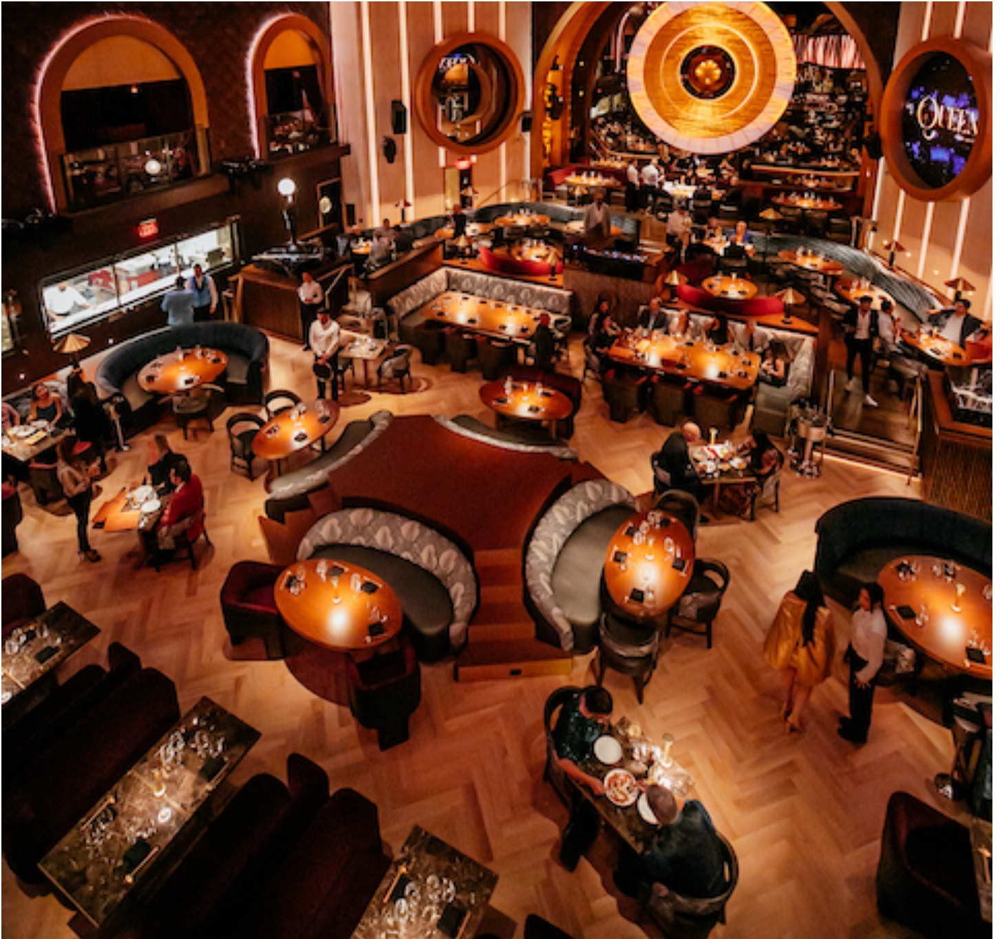
Carlos Rodríguez de ModPlay Studio se inspiró en el estilo Art Decó original del edificio.