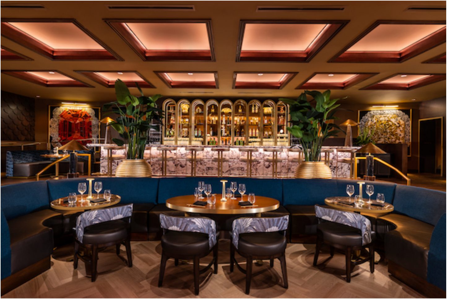
Queen Miami Beach, algo nuevo en Miami, con el lujo de antes.